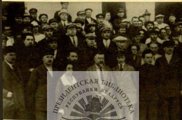
А. Г. Червяков среди делегатов съезда Советов СССР (1929 г.).