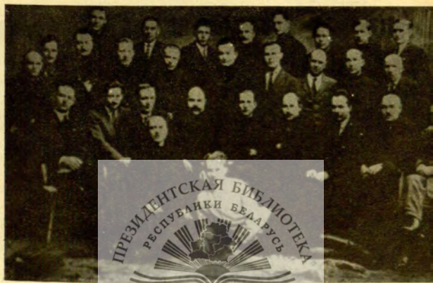
А. Г. Червяков среди делегатов VIII съезда Советов БССР.