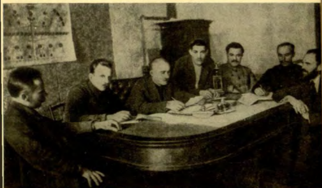
Президиум ЦИК БССР, 1921 г. Третий слева А. Г. Червяков.