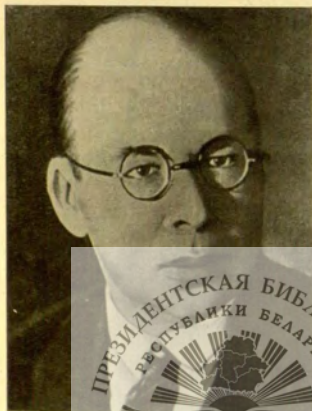
Д. Ф. Жилунович — первый председатель Временного рабоче- крестьянского прави- тельства Белоруссии