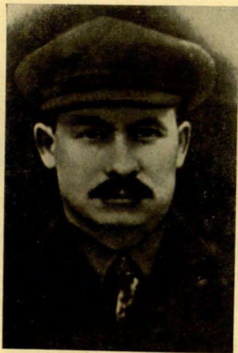
А. Г. Червяков в последние годы своей жизни