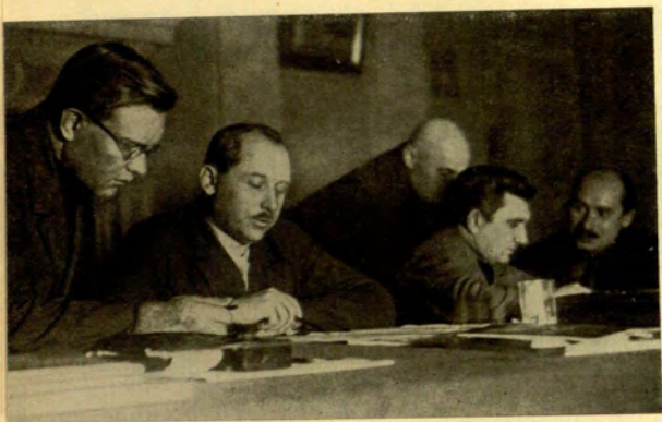
Заседание ЦИК БССР. Первый справа А. Г. Червяков.

Академик А. Н. Бах, А. Г. Червяков, Народный комиссар здравоохранения СССР Н. А. Семашко и председатель Всеукраинского ЦИК Г. И. Петровский. Москва, 1929 г.